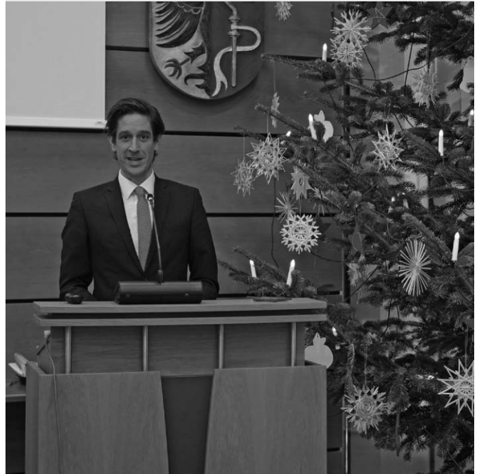
Landrat Mario Glaser bei der Verabschiedung des Kreishaushalts 2025

sam Wege finden werden, um unseren Landkreis auch unter diesen Bedingungen weiterhin erfolgreich zu gestalten. Der vorliegende Haushalt ist das Ergebnis intensiver Diskussionen und Kompromisse. Er mag nicht alle Wünsche erfüllen, aber er bildet eine solide Basis für die Weiterentwicklung unseres Landkreises.“ Landrat Mario Glaser blickte dabei auch auf die anstehenden Investitionen: „Trotz der finanziellen Herausforderungen bin ich stolz darauf, dass wir in den vergangenen Jahren viel in unsere Infrastruktur investieren konnten. Mit einer geplanten Investitionssumme von 145 Millionen Euro für die kommenden vier Jahre setzen wir diesen Kurs fort.“