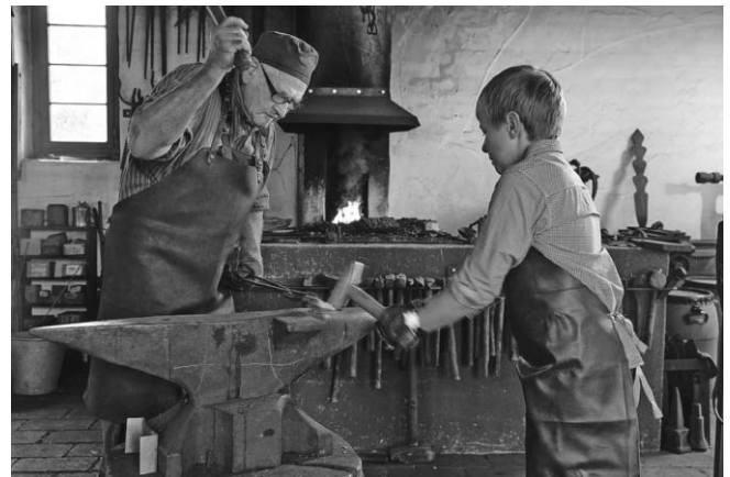
Für Sonntag, 19. Mai, lädt das Museumsdorf Kürnbach zur Kinderwerkstatt „Mit Hammer und Amboss“ ein.