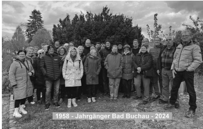
1958 - Jahrgänger Bad Buchau - 2024